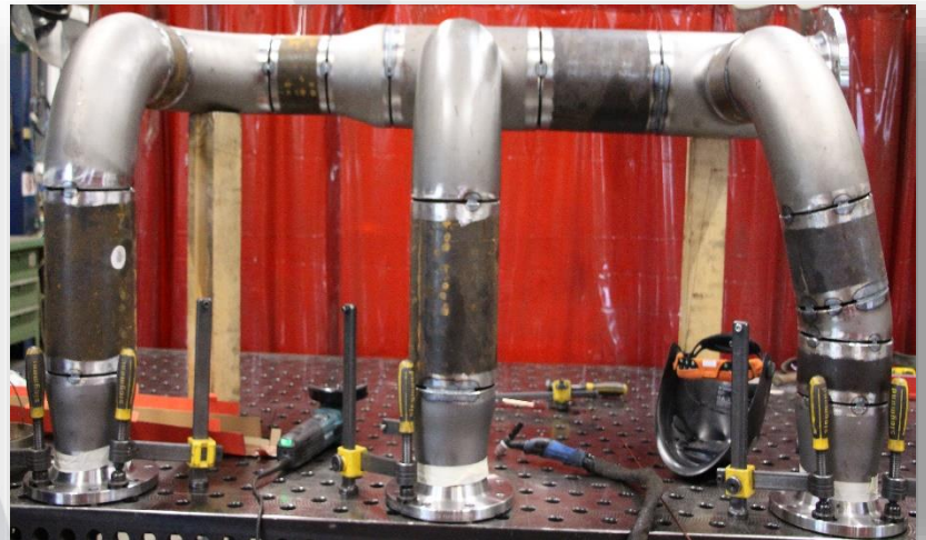
Vorfertigung von Rohrleitungen für eine Pumpengruppe einer Thermalölrohrleitung, Werkstoff-Nr. P235GH TC1

Entdecken Sie Möglichkeiten: www.luetkemueller.de